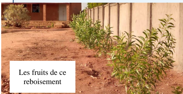
Les fruits de ce reboisement

Pour terminer Chers Bienfaiteurs, nous voulons vous dire à quel point nous sommes reconnaissantes pour votre aide. Votre soutien est précieux pour nous.